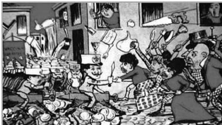
Revolta da Vacina, no centro Oswaldo Cruz, 1904