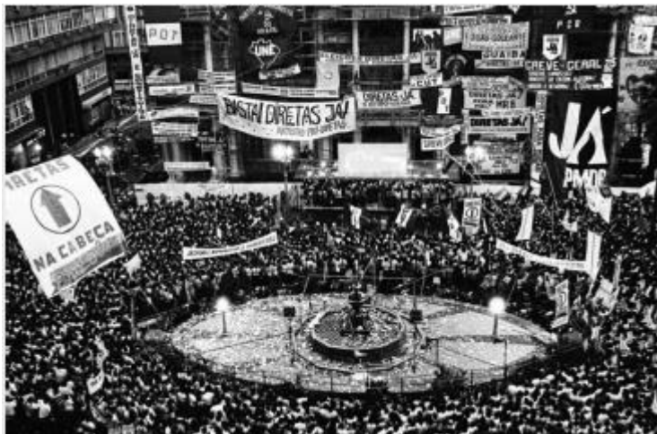
Comício pelas Diretas Já! 13/04/1984 Largo da Prefeitura de Porto Alegre-RS.

A imagem acima representa um dos aspectos que evidenciou a crise da ditadura militar, após 20 anos de vigência. Em relação ao processo de abertura democrática, analise as afirmações: