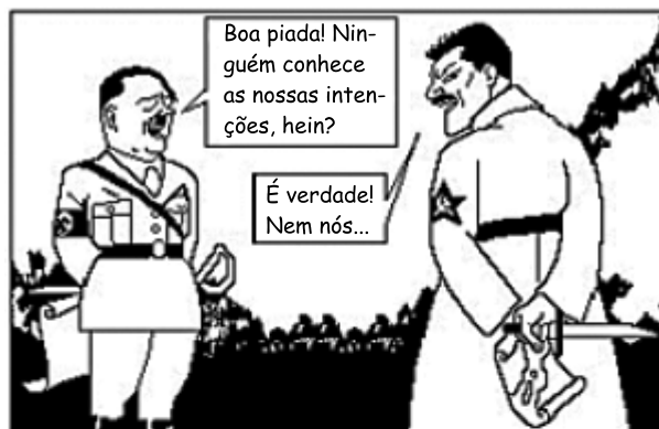
DOIS BONS CAMARADAS Belmonte

(BELMONTE. Folha da Noite, 22 set. 1939. In: Caricatura dos Tempos )