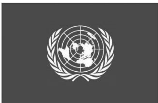
Bandeira da Organização das Nações Unidas (ONU)